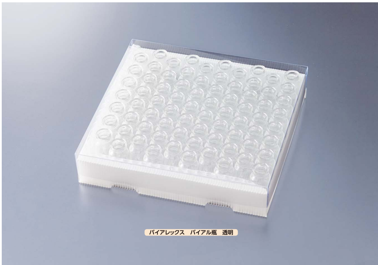
バイアレックス バイアル瓶 透明