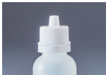
改ざん防止機能付 (MLエムキャップ)