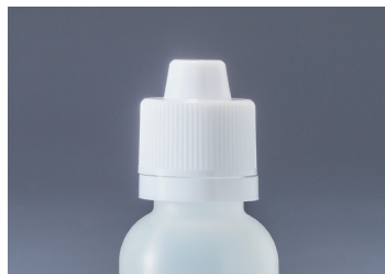
チャイルドロック機能付 (MLロックキャップ)